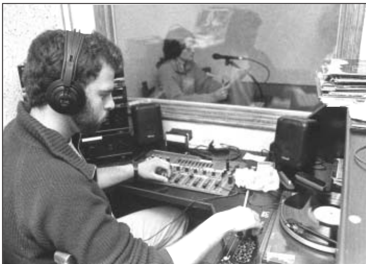
primer día de emisión de Txantrea Irratia, el 3 de abril de 1993

A principios de la década de los ochenta, las iniciativas populares de comunicación vivieron un importante boom, con la irrupción de todo un fenómeno social, las radios piratas. A través de ellas, la palabra voló libre. De forma más o menos rudimentaria en los comienzos, de manera mucho más cuidada en la actualidad, las ondas de estas emisoras dieron vida y voz a los sin voz. La libertad de expresión se ejerció, como debía ejercerse si esta pretendía ser expresión libre: sin permiso.