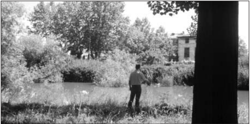
el Arga, una riqueza que debemos preservar

Sin embargo, todo lo anterior no es lo más grave. El Club Natación forma un embudo o embotellamiento del río en este tramo contra la alta ripa de la Media Luna, de forma que encañona el agua. así, lo que sería una casi inofensiva inundación o crecida, se convierte en una violenta y destructora riada. ¿Cuándo se va a obligar a este club a devolver lo que no le corresponde y a dejar de perjudicar a los de aguas abajo? ¿Cuándo van a cumplir las dos resoluciones judiciales que les obligan a destapar el tramo del histórico "Río de los Leños" que enterró para hacerse su aparcamiento?