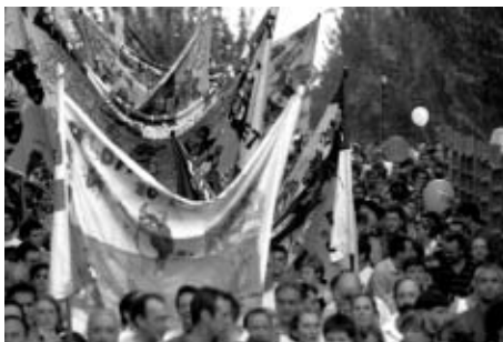
Las peñas sacaron a la calle las pancartas pidiendo el referéndum.