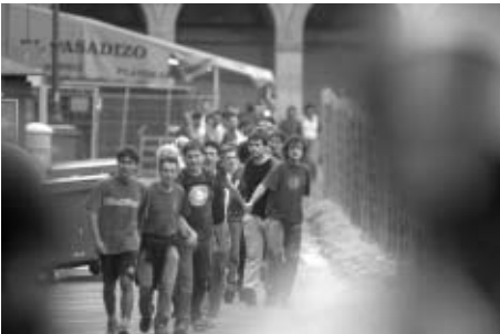
Una cadena humana avanza hacia una dotación policial.