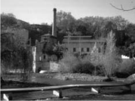
Las nuevas pasarelas y, al fondo, el Molino de Caparoso.

surge a la izquierda y conduce a las Pasarelas, encajonada entre huertas rodeadas de verjas altas.