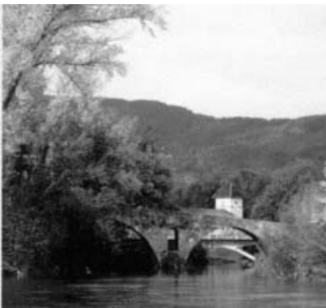
Dos vistas del puente de la Magdalena.

alta tensión con la amenazadora leyenda "No tocar". Al final del camino que el Sendero Urbano ha seguido hasta ahora, será obligado torcer a la derecha para tomar, por fin, la carretera de la Magdalena. En este punto, en las inmediaciones de una serrería y todavía en territorio de Burlada (más en concreto en el término de la Morea), el caminante toma contacto, por primera vez, con el Camino de Santiago, a más de 750 kilómetros de su destino en los confines de tierras gallegas.