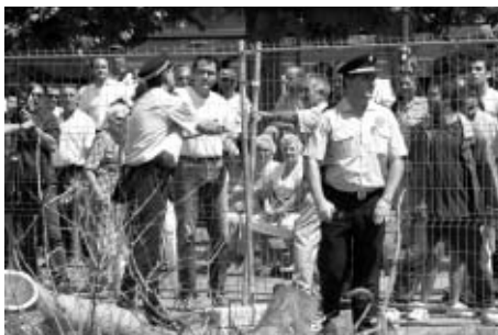
Muchos vecinos se fueron congregando para protestar por las obras.