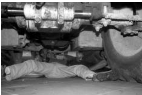
Varias personas intentaron detener los trabajos.