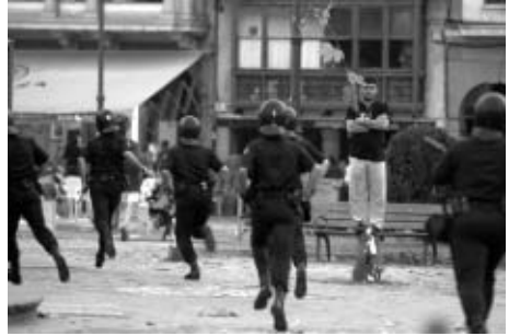
En el transcurso de las protestas ha habido 48 detenidos.