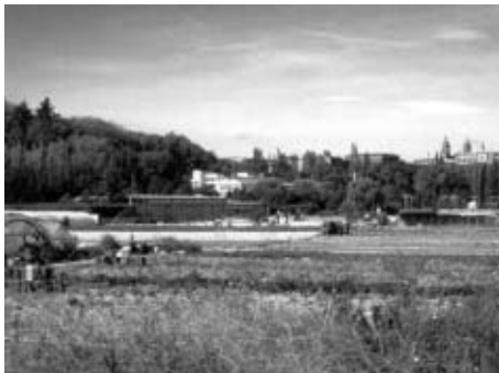
En el trayecto se pueden contemplar las huertas de la Magdalena.