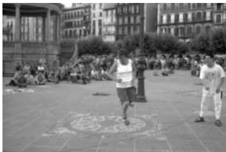
La plataforma recalca el carácter lúdico y festivo de sus movilizaciones.