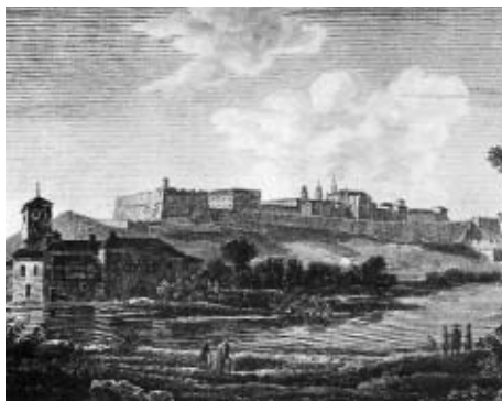
La Magdalena era una de las zonas de baños de los pamploneses.

Los diferentes Ayuntamientos siempre han exigido al poblador de extramuros las mismas cargas que a «los de Pamplona», pero aquellos nunca tuvieron, y quien lo niegue miente, los mismos derechos. Se le ha exigido durante años unas condiciones higiénicas casi imposibles de cumplir, en forma de pozos, inspecciones a las tabernas (algunas clausura-