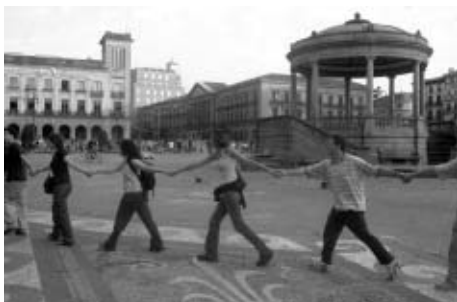
Al final los vecinos volvieron a disfrutar de la plaza...