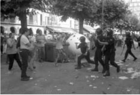
La policía cargó duramente contra los vecinos y hubo varios heridos.