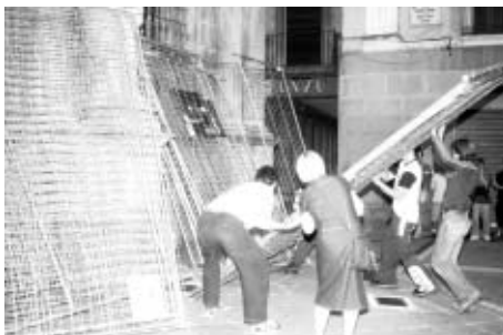
... y las vallas terminaron en la puerta del Ayuntamiento.