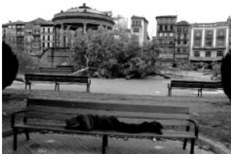
La tala de los árboles se inició a las 5 de la madrugada.