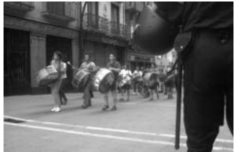
Hubo varios estruendos pidiendo la desmilitarización de la plaza.