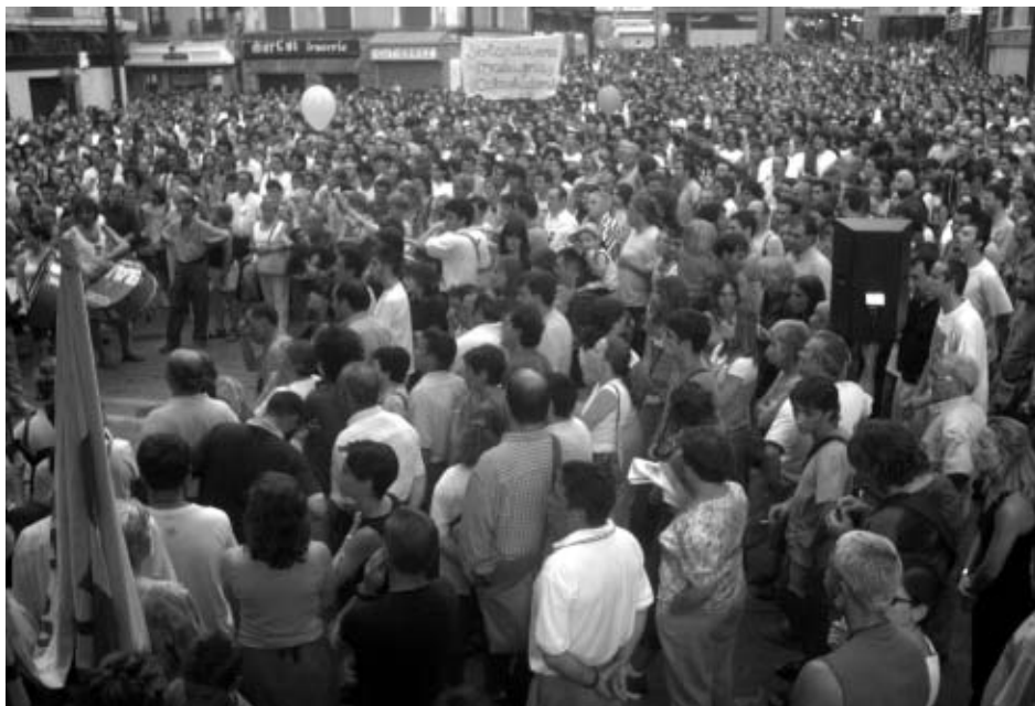
La Plaza Consistorial se quedó pequeña en la manifestación del 1 de agosto. La plataforma cifró en 14.000 las personas asistentes.