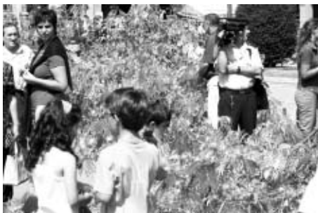
La Policía Municipal detuvo a seis personas en la primera mañana.