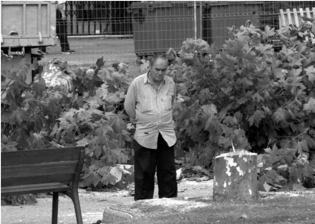
Un ciudadano observa lo que queda de un árbol. Hubo vecinos que no pudieron contener las lágrimas al ver el aspecto que presentaba la plaza.