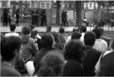
Las sentadas acabaron generalmente en carreras.