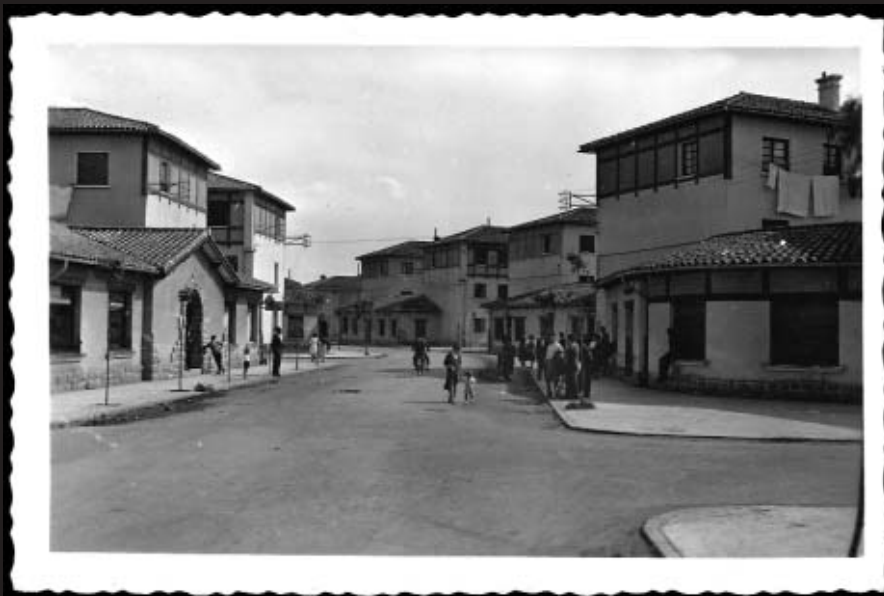
Beorlegui, la "Calle Mayor" de la época

En aquella incipiente Txantrea de los años 50, la calle Beorlegui se constituyó como el eje vertebrador de nuestro barrio. A pesar de ello, ni un sólo coche aparece en la imagen superior, en una vista que se asemeja más a la de un pueblo que a la de una ciudad. Es fácil adivinar la tranquilidad y la quietud que se respiraban por entonces en nuestras calles.