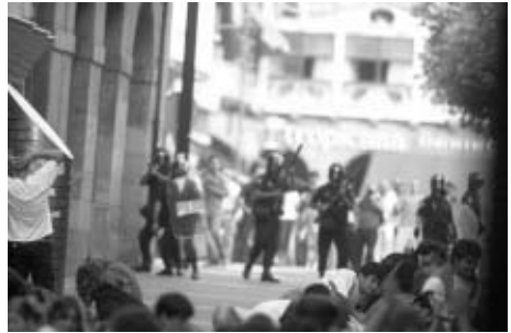
Decenas de agentes impedían a los vecinos acceder a la plaza.